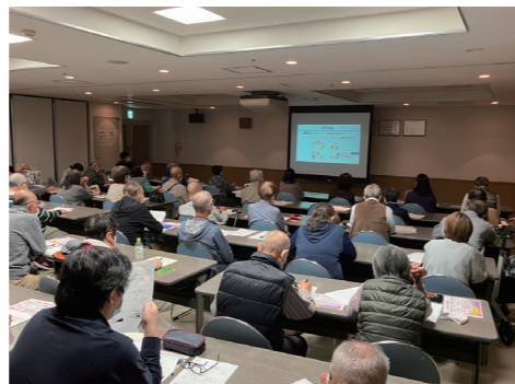
第3回腎臓病教室の様子

に参加できてよかったとお声をいただき、また今後も研修の必要性を認識していただきました。来年度も「第4回腎臓病教室」の開催を計画しております。ぜひまたご参加ください。