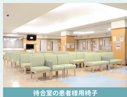
待合室の患者様用椅子

待ち時間を少しでも快適にお過ごしいただくため、8番(外科系待合室)、9番(内科系待合室)ブロック、正面待合の患者様用椅子を一新しました。