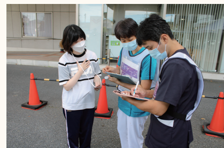
治療の優先度を定める「トリアージ」を行なう様子

今回の訓練を通して、各職員の役割や連携の重要性が再確認できました。更に、DXシステムを取り入れた事で、情報共有の迅速さが病院機能の維持に直結することが明らかになりました。今後も定期的に防災訓練を実施し、災害拠点病院として地域の皆様の命と健康を守るように努めて参ります。