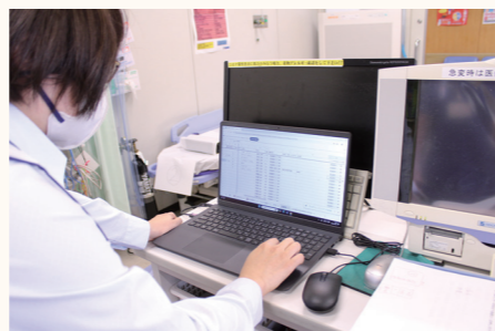
迅速に情報共有を可能にするDXシステム