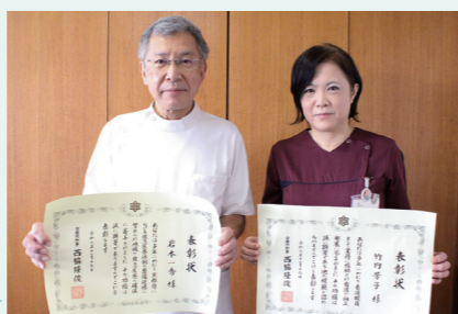
京都府保健医療功労者等表彰式の表彰状

令和6年度京都府保健医療功労者等表彰式において、若本院長が京都府救急医療功労者として、竹内看護部長が京都府看護功労者として知事表彰を受けました。