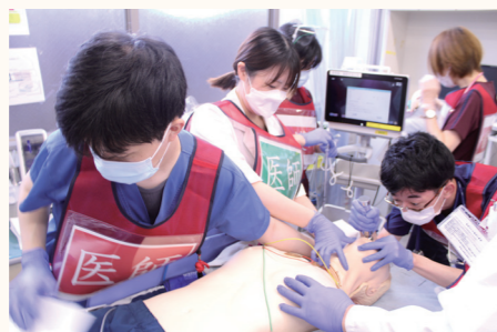
緊急性の高い傷病者の処置にあたる医師